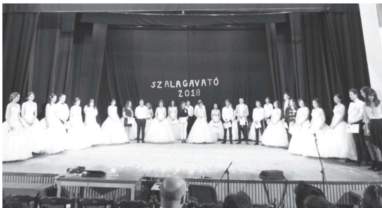
Életük egyik nagy pillanata: mellükre került a nagykorúvá válást jelző szalag