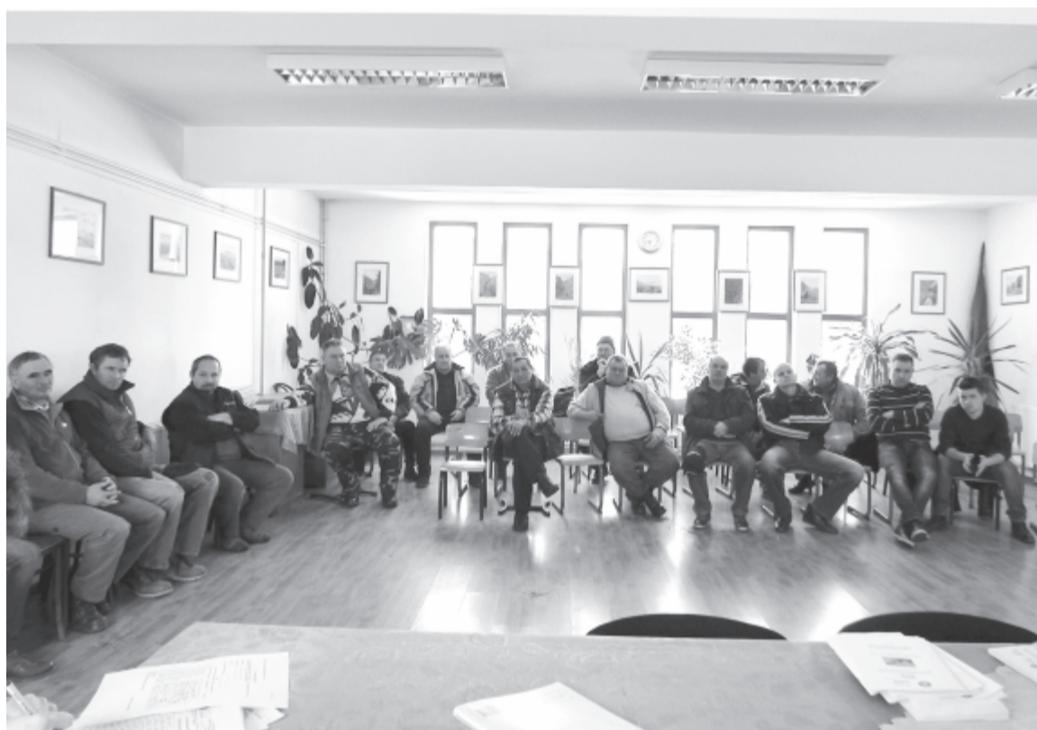
Az utolsó napokban is tájékoztatták a gazdákat

Szóba került még a paradicsomtermelőknek járó kormánytámogatás, illetve a sokak által erőltetettnek és nem kellően átgondoltnak tartott új sertésenyésztési támogatási program is. A gazdák a jelentős késésekkel átutalt támogatásokra és az évről évre szigorított, de nem mindig logikus feltételekre panaszkodtak, a szakemberek pedig a megterheltségre, miközben még az is megtörténhet – az előző évekhez hasonlóan –, hogy a számítógépes bejegyzéshez szükséges országos program az első napokban akadozni fog. A támogatási kérelmeket március 1. és május 15. között lehet benyújtani, azután már csak napi késedelmi büntetés ellenében.